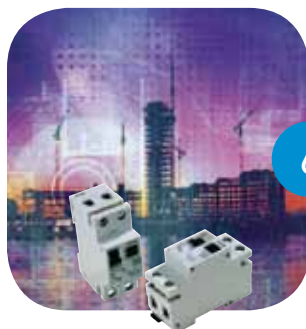
6 Disjoncteurs/ disjoncteur-différentiels