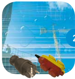
2 Prises en brochage/ multiprises