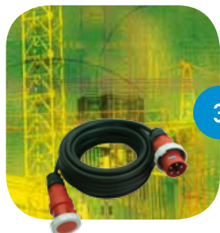
3 Câbles de raccordement/ rallonges/enrouleurs