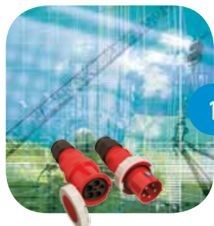
1 Prises de courant Eurokontakt® CEE 17