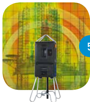
5 Coffrets à compteur